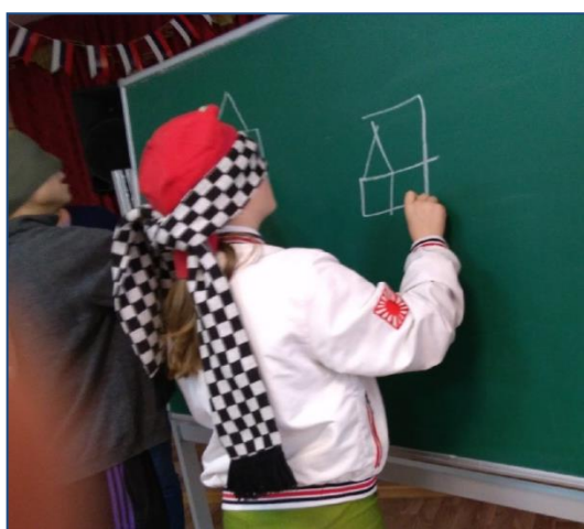
С закрытыми глазами нарисовать на доске дом.

Ребятам были предложены практические упражнения , которые способствовали понять какие трудности испытывают инвалиды в повседневной жизни.