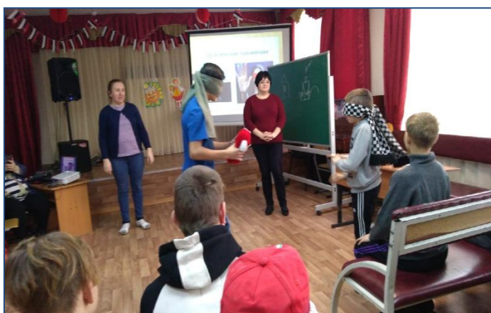
Принести предмет закрытыми глазами